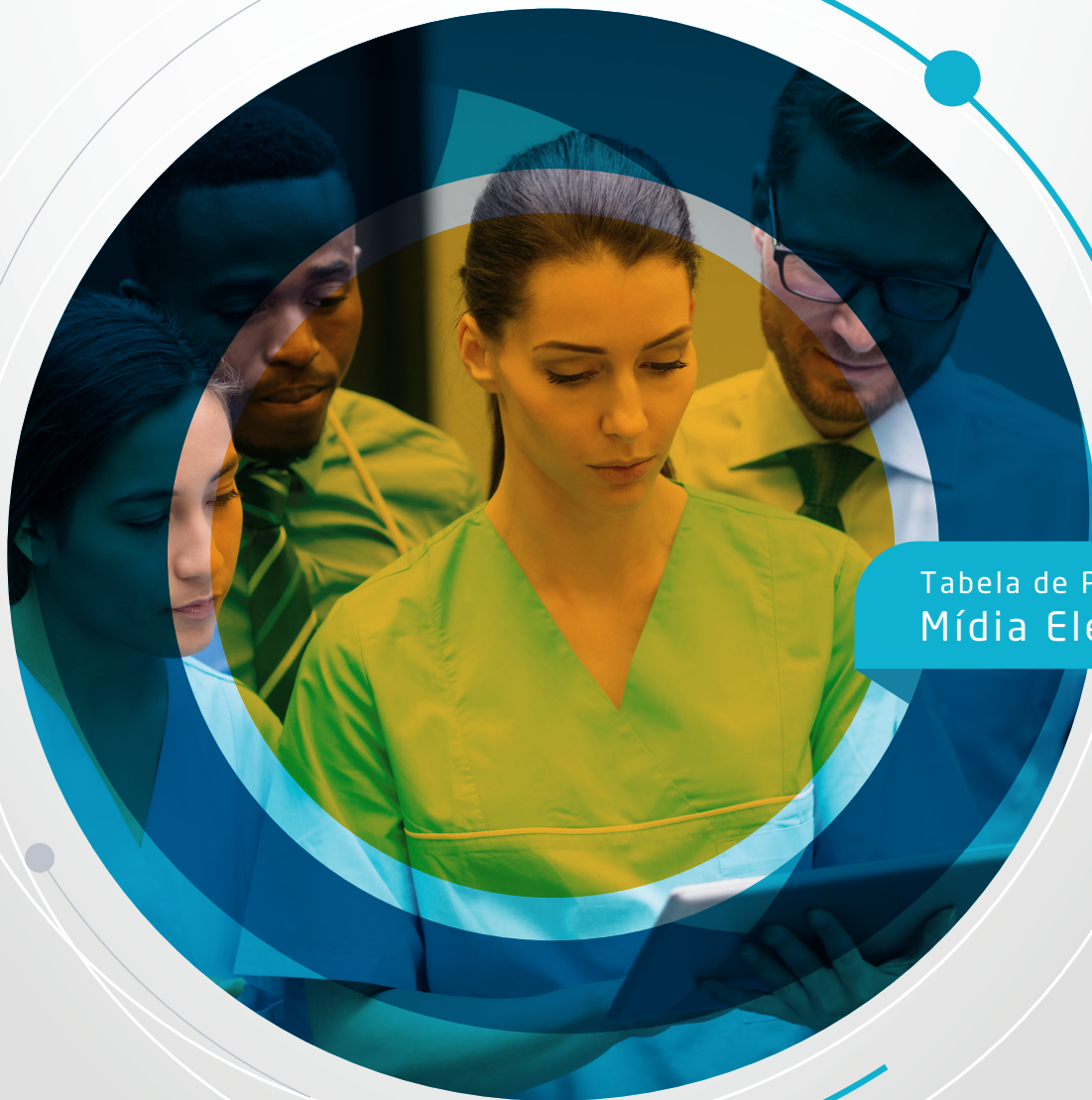
Tabela de Publicidade Mídia Eletrônica