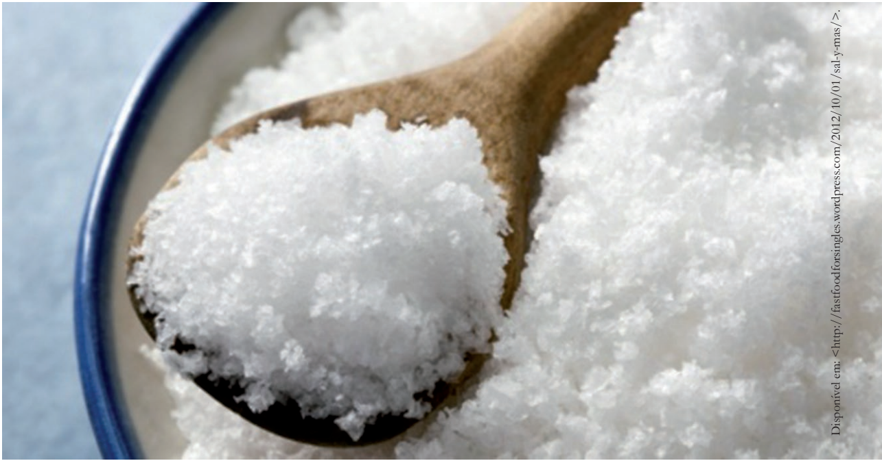
Cristais de sal