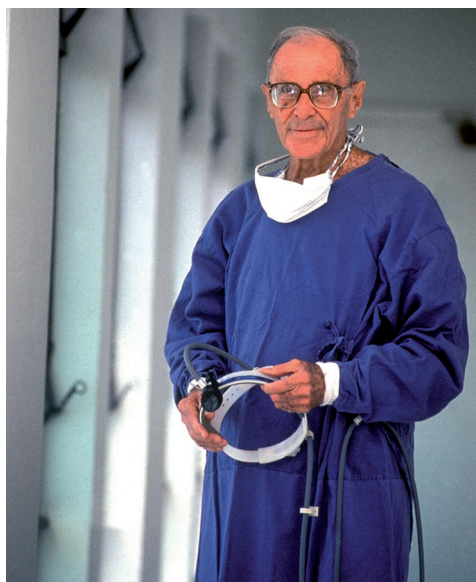
Prof. Zerbini na sala cirúrgica do Bloco I do Incor (sem data)