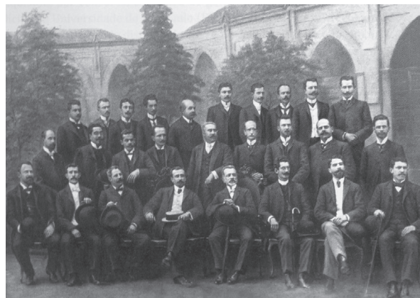
Médicos do corpo clínico da Santa Casa de Misericórdia de São Paulo, em 26 de novembro de 1903